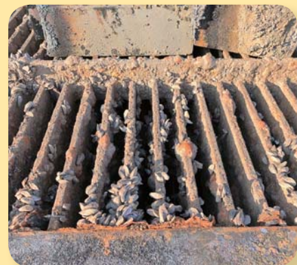
カワヒバリ貝が付着したスクリーン

カワヒバリ貝付着による通水障害が多く発生していたことから、平成29年度にカワヒバリ貝付着の少ない銅製のスクリーンに更新しました。これまで発生していた機器の不具合が減少し、より安定した用水をお届けできるようになりました。